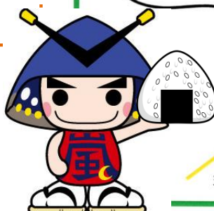
嵐山町マスコットキャラクターむさし嵐丸